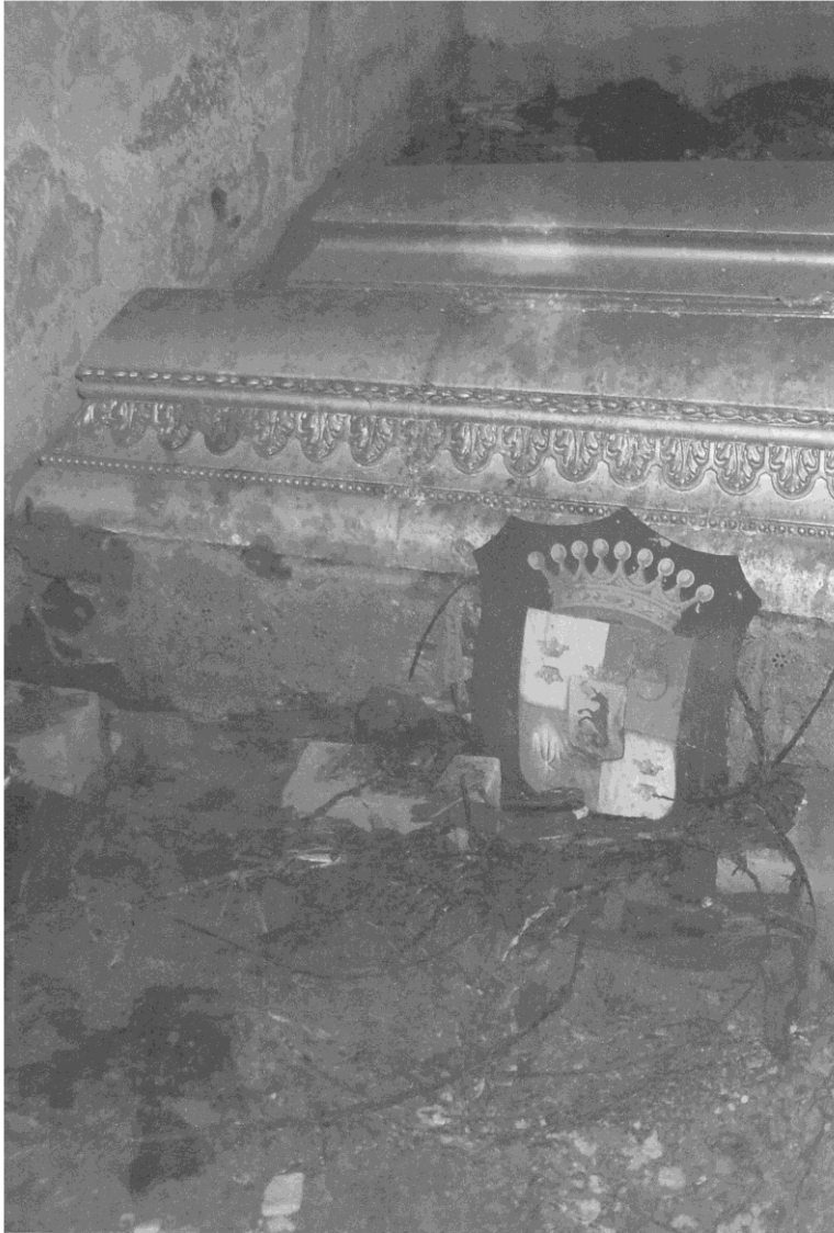
Hrobka v Častohosticích