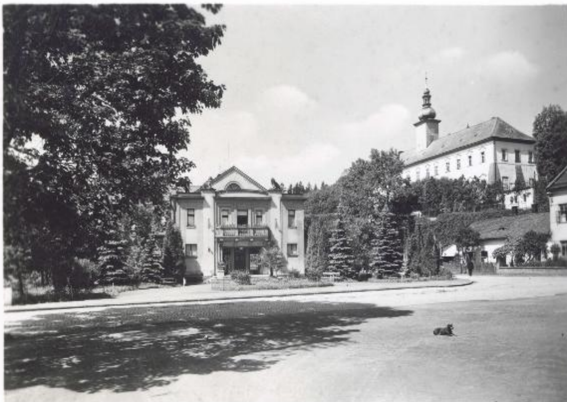
Zámek Letohrad 1975