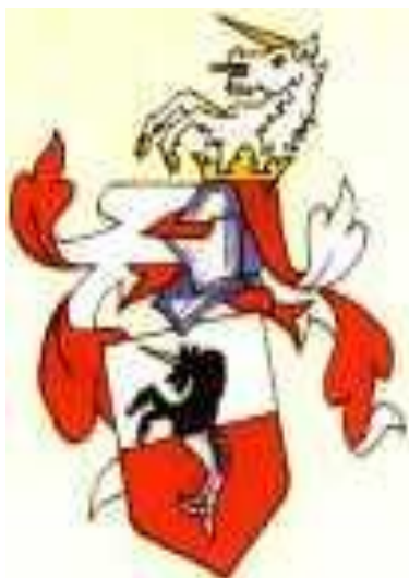
Znak rodu Nimptschů, držících Kyšperk 1834 - 1875

ASI PO 40 LETECH BYLA V DUBNU r. 2010 ZPŘÍSTUPNĚNA HROBKA POD KOSTELEM SV. BARBORY V ČASTOHOSTICÍCH. V HROBCE JSOU UMÍSTĚNY POZŮSTATKY MAJITELŮ NOVOSYROVICKÉHO PANSTVÍ. PO PROZKOUMÁNÍ PROSTOR PRACOVNÍKY PAMÁTKOVÉHO ÚSTAVU BYLA OPĚT ZAZDĚNÁ.