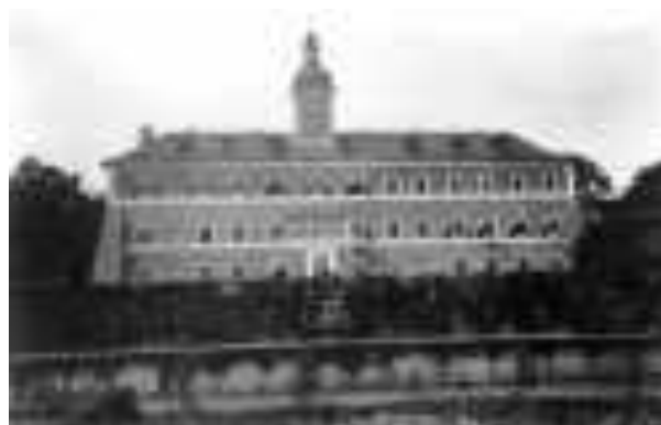
Zámek Kyšperk v roce 1900