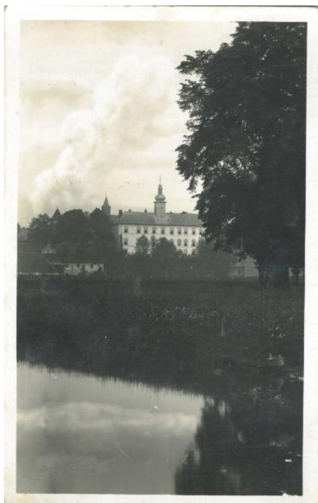
Zámek Kyšperk v roce 1955 (už Letohrad)